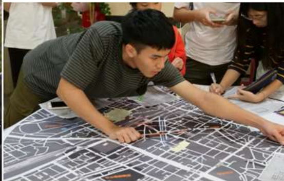
白色恐怖地圖工作坊