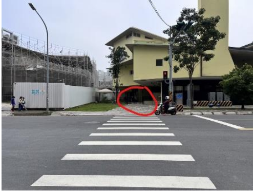
慈濟路A門(文心匯對面，工地旁)