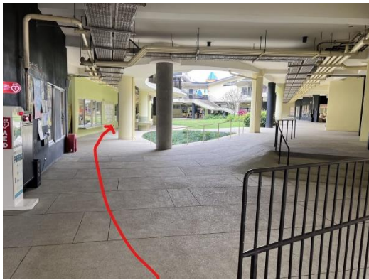
入校後沿左邊小徑走