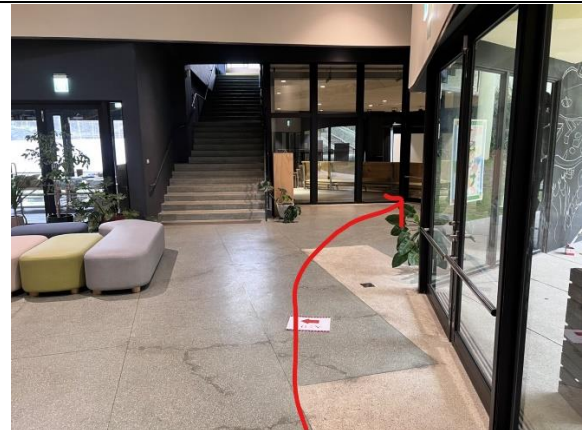
進圖書館後右前方即是視聽教室