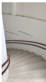
圖書館在 B1, 請往下走