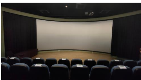
至左方的視聽室作研習報到簽名