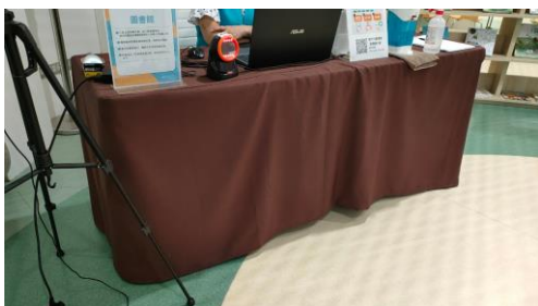
入口處體溫量測與酒精消毒，會事先提供名冊給館方