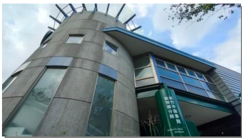
報到地點建築外觀